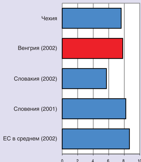
Рисунок 1. Объем финансирования здравоохранения (в % ВВП) в Венгрии и других странах в 2003 г.