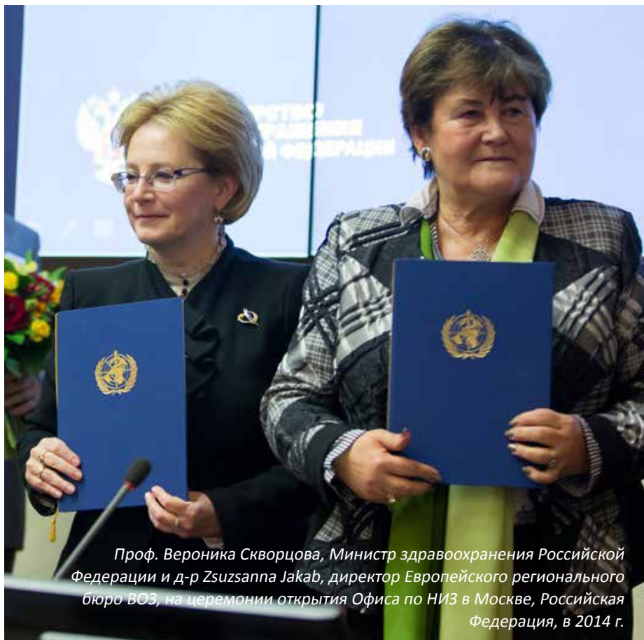
Проф. Вероника Скворцова, Министр здравоохранения Российской Федерации и д-р Zsuzsanna Jakab, директор Европейского регионального бюро ВОЗ, на церемонии открытия Офиса по НИЗ в Москве, Российская Федерация, в 2014 г.

Европейский регион достиг прогресса в ключевых областях борьбы с НИЗ. Продолжает снижаться смертность от сердечно-сосудистых заболеваний, по-прежнему прослеживается четкая тенденция к снижению распространенности курения, стабильно сокращается потребление алкоголя. Тем не менее, такая общая картина в Европейском регионе маскирует значительные различия между странами и отдельными группами населения, особенно среди молодежи. НИЗ продолжают оставаться ведущей причиной смертности, нарушений здоровья и инвалидности в Европейском регионе