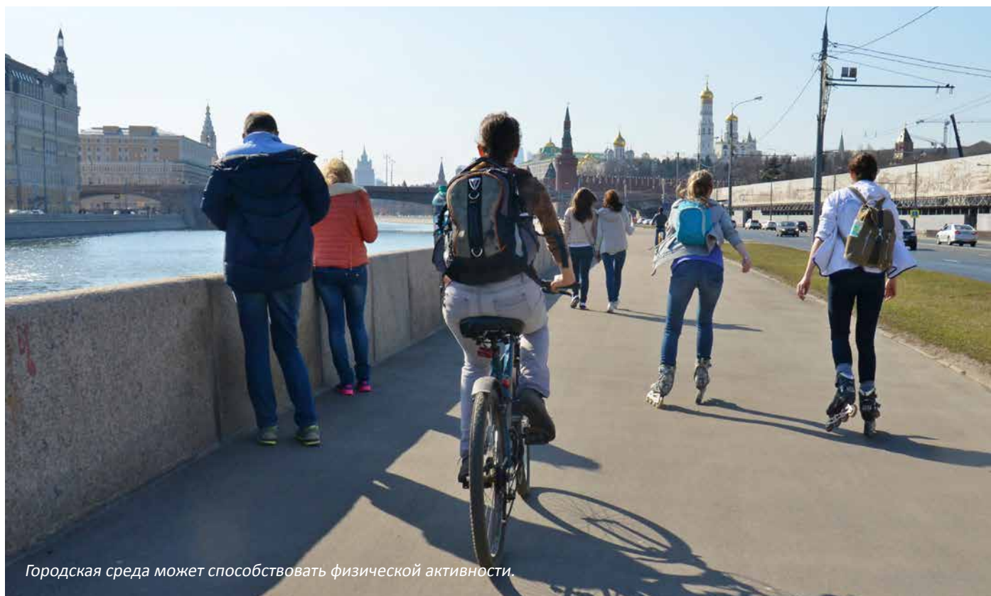
Городская среда может способствовать физической активности.

Офис по НИЗ применяет новаторские подходы к решению вопросов профилактики НИЗ с помощью использования медиа-среды, являющейся привычной для современного человека. Примером могут служить следующие мероприятия: