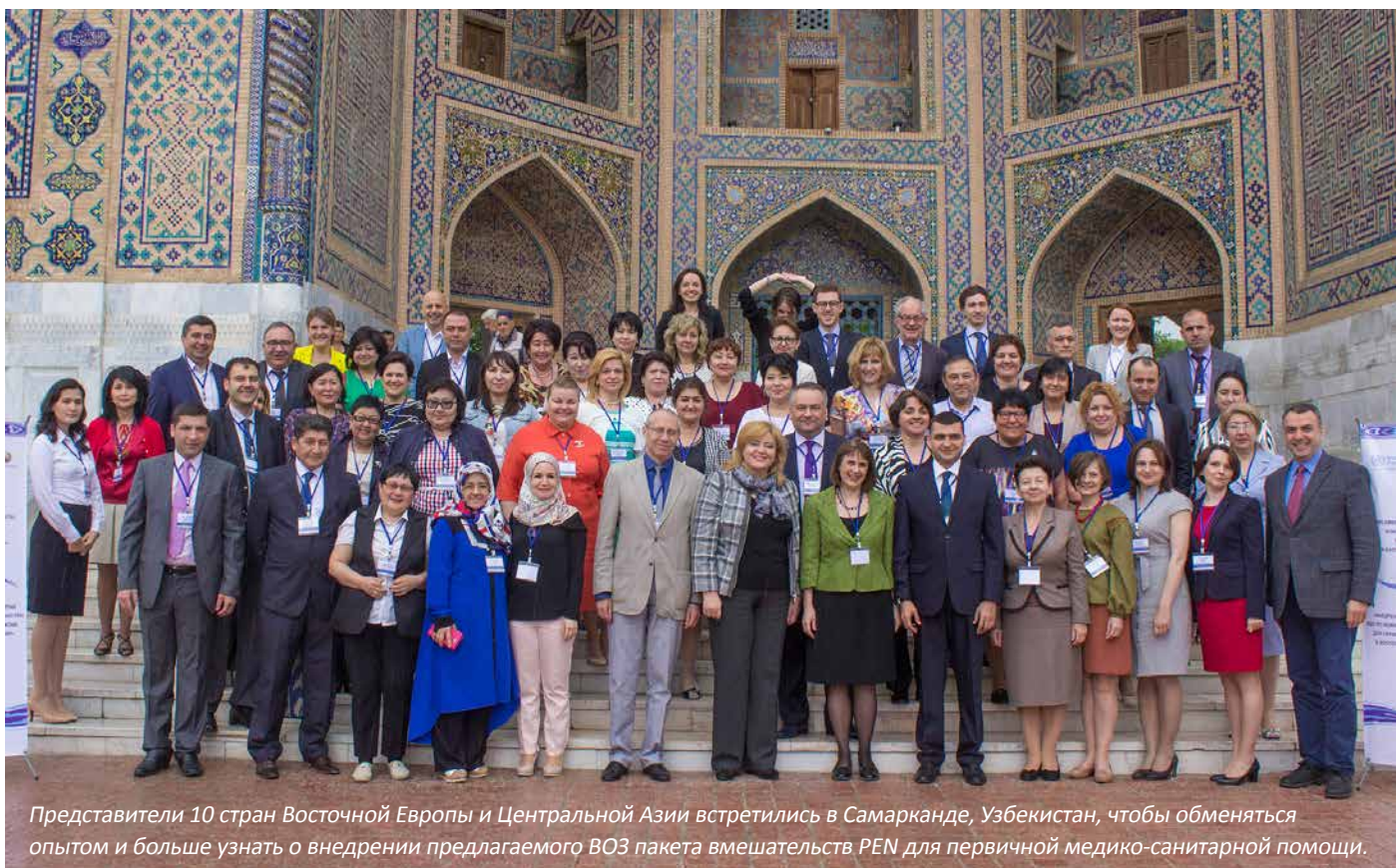
Представители 10 стран Восточной Европы и Центральной Азии встретились в Самарканде, Узбекистан, чтобы обменяться опытом и больше узнать о внедрении предлагаемого ВОЗ пакета вмешательств PEN для первичной медико-санитарной помощи.