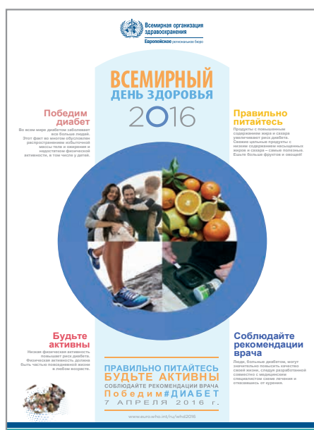
Всемирный день здоровья 2016 г. был посвящен профилактике, лечению и ведению случаев сахарного диабета.

В мае 2016 г. в Москве группа национальных специалистов и экспертов, включая представителей Центра МакКейба по вопросам права и онкологических заболеваний и ФГБОУ ВО «Первый Московский государственный медицинский университет им. И.М. Сеченова» Минздрава России, провела интенсивный учебный семинар по юридической подготовке и укреплению потенциала в вопросах правовых подходов и эффективных вариантов политики в отношении табака, алкоголя и нездорового питания. Одним из результатов семинара стало создание сети экспертов из 12 стран, четко осознающих необходимость взаимодействия между секторами здравоохранения и торговли. Курс проводился как пилотный, и ФГБОУ ВО «Первый Московский государственный медицинский университет им. И.М. Сеченова» Минздрава России будет в дальнейшем проводить региональные курсы, с тем чтобы русскоговорящие страны могли твердо придерживаться взятых на себя обязательств, невзирая на создаваемые соответствующими областями промышленности проблемы правового характера.