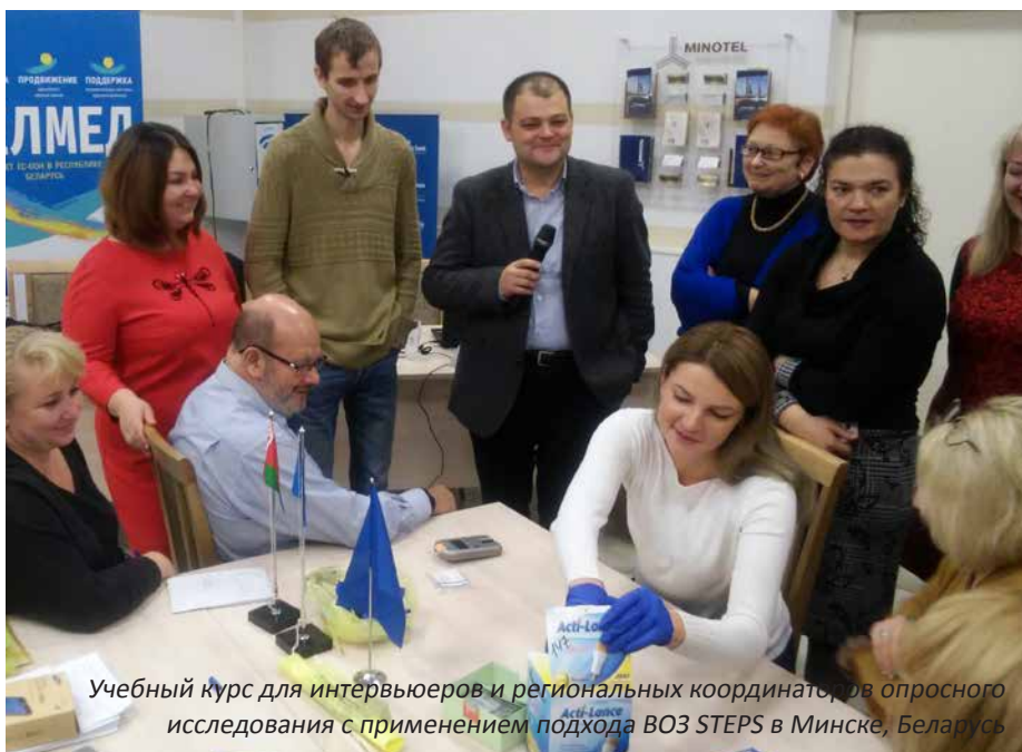
Учебный курс для интервьюеров и региональных координаторов в опросного исследования с применением подхода ВОЗ STEPS в Минске, Беларусь

образование, охрана окружающей среды, жилищное обеспечение и право. Сильной стороной создания национальных планов действий является то, что они основаны на фактических данных, объединяют многочисленных заинтересованных