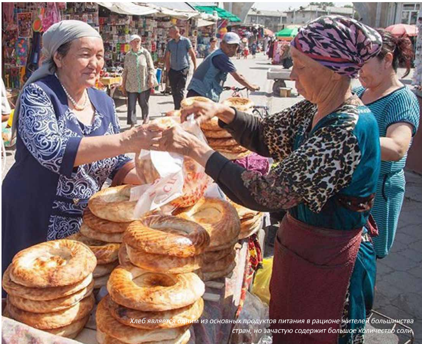
Хлеб является одним из основных продуктов питания в рационе жителей большинства стран, но зачастую содержит большое количество соли