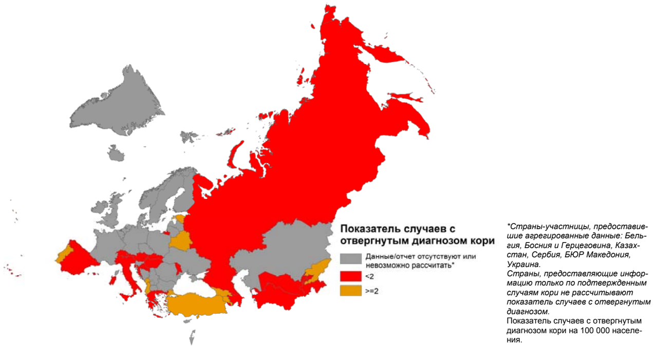
Рис. 1. Карта со Показатель случаев с отвергнутым диагнозом кори в Европейском регионе*, Январь - Сентябрь 18 (данные по состоянию на 07 Ноябрь 2018 г.)**

Указанные границы и названия, а также использованные обозначения не выражают мнения Всемирной организации здравоохранения о правовом статусе любой страны, территории, города или района, или их властей, или же о делимитации их территорий или границ. Пунктирные линии на картах обозначают примерные границы, по которым возможен на еще не достигнута полная договоренность.