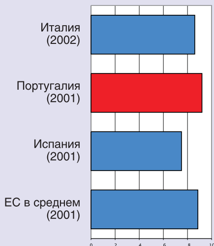
Рисунок 1. Общие расходы на здравоохранение (% ВВП) в Португалии, в некоторых странах и ЕС в среднем