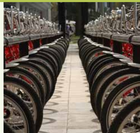
Схемы проката велосипедов могут создать в Испании 4,2 тыс. рабочих мест.

http://ebikespace.com/stuttgart-wheeling-its-way-pedelec-city-statut/ ; http://www.un.org/esa/dsd/resources/res_pdfs/csd-19/Background-Paper8-P.Midgley-Bicycle.pdf ; http://ftp.sevillafilmmoffice.com/velo-city2011/presentaciones/dia25/Plenario_4/Joaquin_Nieto.pdf