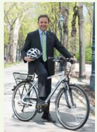
Бум электрических велосипедов в Австрии: польза для экономики и окружающей среды

www.klimaaktivmobil.at ; www.green-jobs.at ; www.lebensministerium.at ; robert.thaler@lebensministerium.at