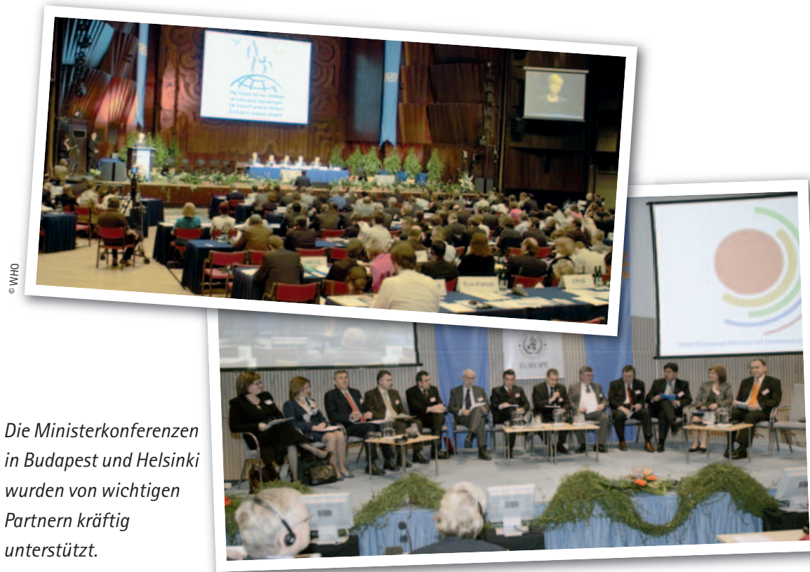
Die Ministerkonferenzen in Budapest und Helsinki wurden von wichtigen Partnern kräftig unterstützt.

Abstimmung zwischen dem Regionalbüro und der Europäischen Kommission ausdrücklich unterstützt.