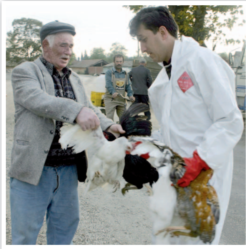
Hühnerübergabe an die Gesundheitsbehörden zur Keulung während des Vogelgrippeausbruchs in der Türkei.