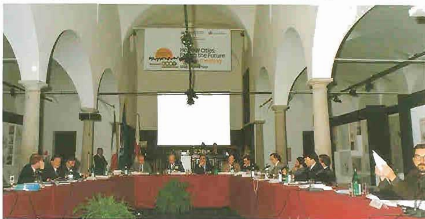
Gesunde Städte: Die Zukunft meistern, Treffen der Bürgermeister und leitenden Mitarbeiter der 30 Projektstädte im April 1989 in Mailand