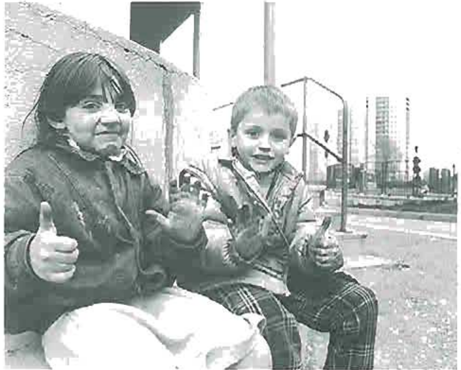
Gesundheitliche Chancengleichheit und Bedürfnisse gesundheitlich besonders gefährdeter Gruppen: Schwerpunkt des Gesunde-Städte-Projekts in Mailand

Wir, die Bürgermeister und führenden politischen Vertreter der WHO-Projektstädte, die sich am 5. und 6. April 1990 in Mailand zusammengefunden haben, bekräftigen unsere Verpflichtung gegenüber den Grundsätzen des Gesunde-Städte-Projektes der WHO und erklären: