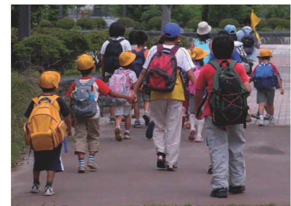
Пешеходный Автобус- естественный вид передвижения - не только сохраняет окружающую среду, но и даёт детям дополнительную возможность двигаться и общаться