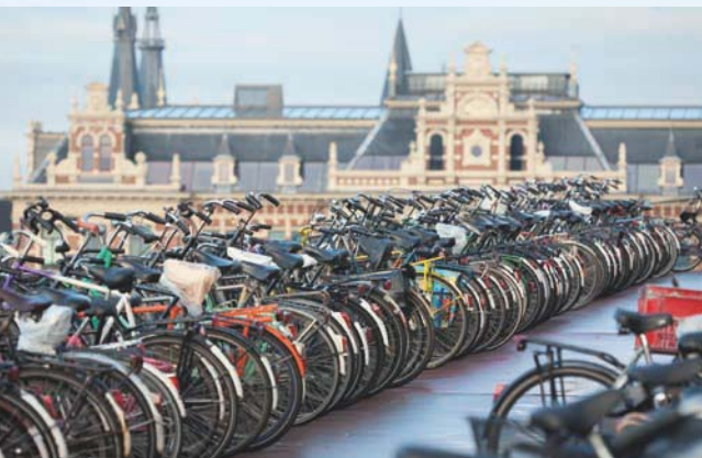
Амстердам, велосипедная столица мира