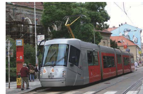
Хорошо работающая система общественного пассажирского транспорта – признак города, в котором приятно жить