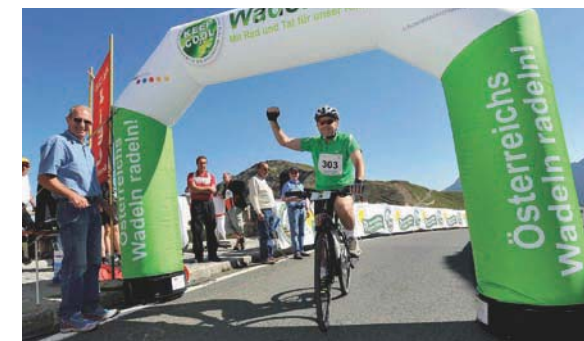
Министр сельского и лесного хозяйства, охраны окружающей среды и водных ресурсов Австрии Николаус Берлакович приходит к финишу в первой гонке велосипедов с электродвигателями на перевале Гроссглокнер