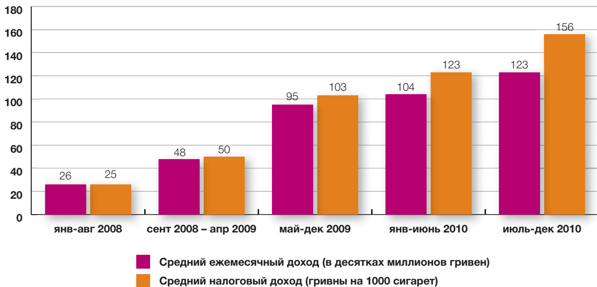
Рис. 2. Доход бюджета и налоговый доход от акциза на табак на Украине, 2008–2010 гг.

от правительственной, так и от оппозиционной партии поддержало законопроект, поданный 12-ю членами парламента, а законопроект правительства и Комитета были отклонены.