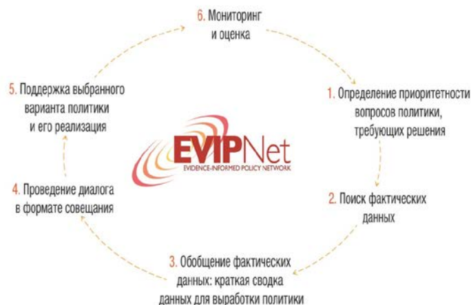
Рис. 2. Цикл деятельности сети EVIPNet-Европа

После создания страновой группы/ПППЗ ее члены должны: